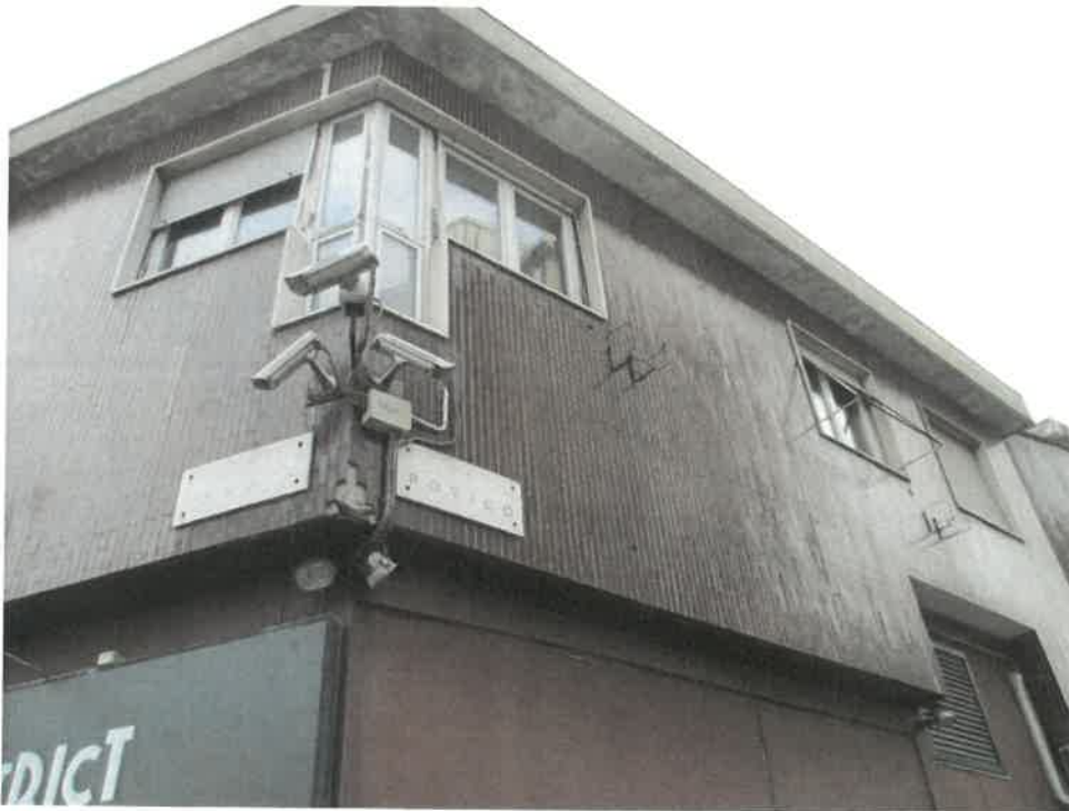
Foto 2: finestre appartamento si notano problemi infiltrativi nella grondaia