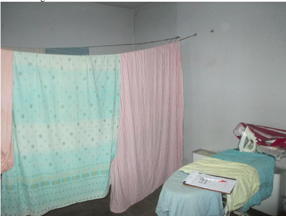
Foto 19: cantina con accorpamento di altra unità adibita a lavanderia